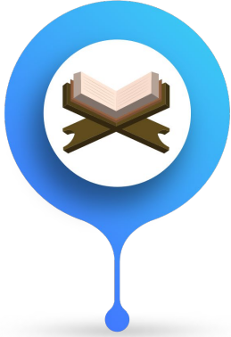
ححص القرآن الكريم Holy Quran Classes