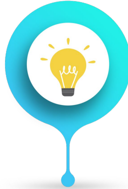
مجالات العلوم والتكنولوجيا STEM